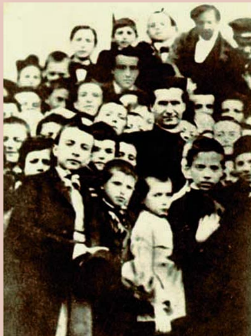
Photo authentique de Don Bosco : photographié parmi un groupe de garçons de l'Oratoire du Valdocco, Turin, en 1861. Parmi les premières, si non la première qui nous est parvenue. Ces photos étaient destinées pour insertion dans la chronique de la maison.

Pascual Chavez Villanueva, Recteur Majeur