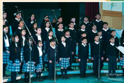
Surrey, B.C.: the Children's choir of OLGC participated in the Christmas Fund Raiser Concert for the victims of the Filipino hurricane devastation.