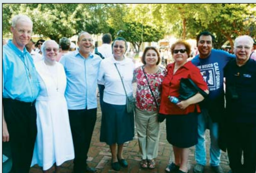
Délégation (partielle) de l'Amérique du Nord.