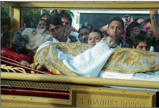
Nord du Mexique