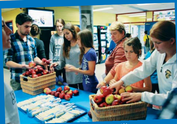
Accueil des nouveaux élèves