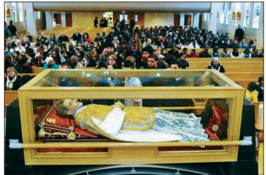
St. Benedict, Toronto, Canada