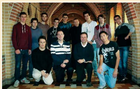
Un 24 h de silence pour des jeunes de la 5 e secondaire du Séminaire Salésien à l'Abbaye St-Benoit-du-Lac.