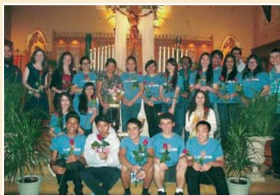
Le Mouvement Salésien des Jeunes de Toronto anime une veillée nocturne mensuelle « Nuit de la Visitation » (prière, adoration, partage de foi, etc).