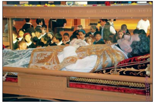
Our Lady of Good Counsel, Surrey, B.C., Canada