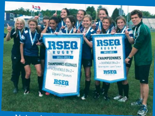
Notre équipe de filles-championne