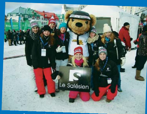
Le 24 h du Mont-Tremblant