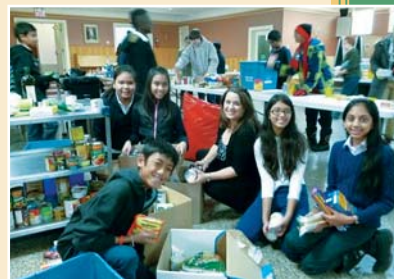
Young volunteers of St. Benedict Parish, Toronto, prepare Christmas baskets for needy families.