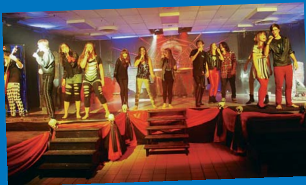
On joue Welcome to my Nightmare