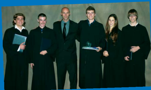
Honneurs à nos diplômés 2013