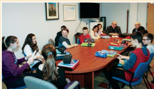
Mgr Luc Cyr, archevêque de Sherbrooke, rencontre un groupe de jeunes du Séminaire Salésien qui se préparent à la Confirmation.