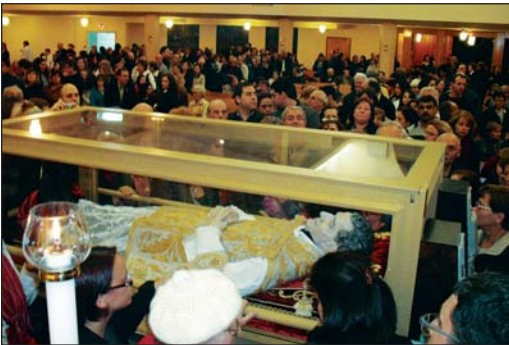
Marie-Auxiliatrice, Montréal, Canada