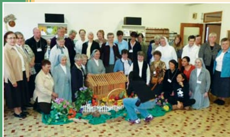
La célébration du Chapitre Provincial des Sœurs Salésiennes à St-Ours en préparation au Chapitre Général.