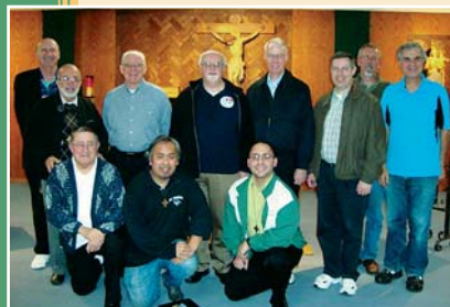
The Provincial Councils of the New Rochelle and the San Francisco provinces meet to share on common interests.