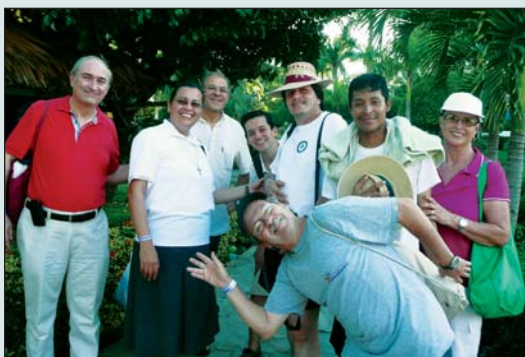
Moment sérieux de la rencontre... !